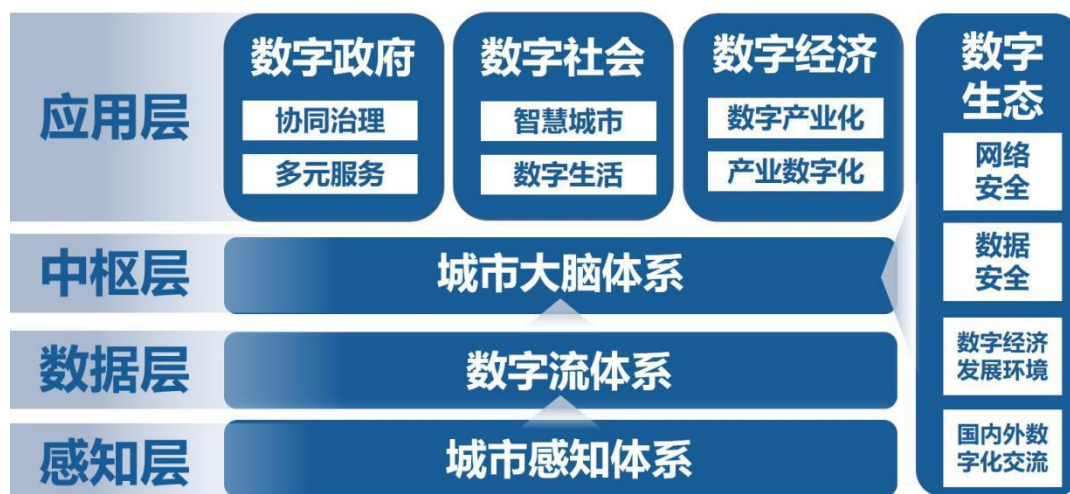
数字福州总体架构图

感知层： 感知层是整个体系的物理基础，是联系物理世界与数字世界的关键纽带，作为城市基础的网络传输资源和传感硬件资源终端，为城市提供高速传输承载和泛在感知能力，以高速泛在、天地一体、云网融合、智能敏捷、绿色低碳、安全可控等为指导，统筹布局感知设施建设，打造安全可靠的基础环境，形成全域一体的数字城市感知神经网络。